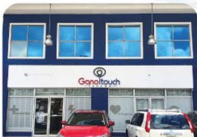
Sucursal Panamá, Ciudad de Panamá