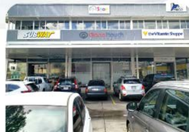
Sucursal David, Chiriquí

Plaza Galería Central, Local N.36 6080-0635 / 6080-0636 pedidos.chiriqui@ganoitouchpanama.com