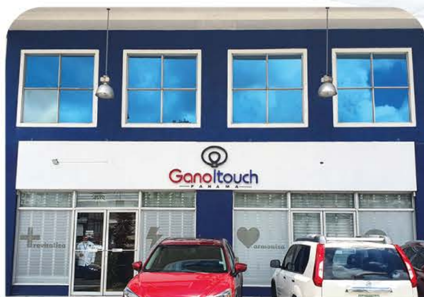
Sucursal Panamá, Ciudad de Panamá