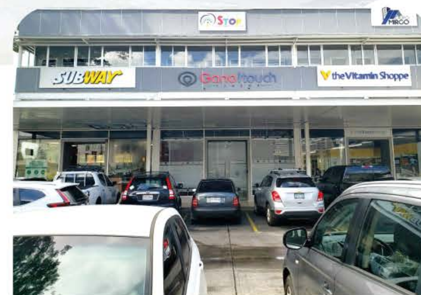
Sucursal David, Chiriquí

Plaza Galería Central, Local N.36 6080-0635 / 6080-0636 pedidos.chiriqui@ganoitouchpanama.com